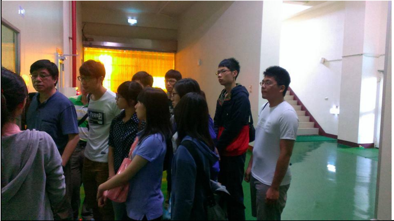
照片(三)說明:解說工廠內部的機器運作