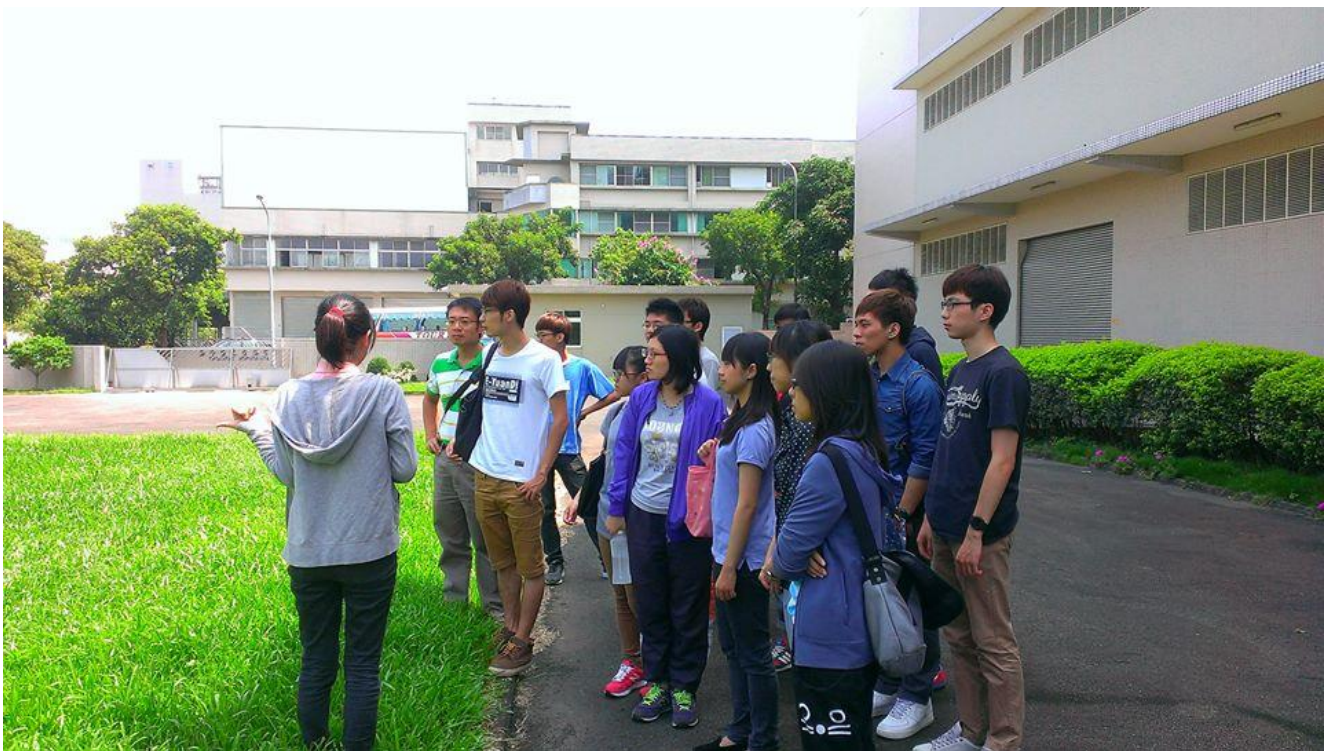
照片(二)說明:解說隸屬於公司的生態池，用來儲蓄汙水處理之後的廢水。