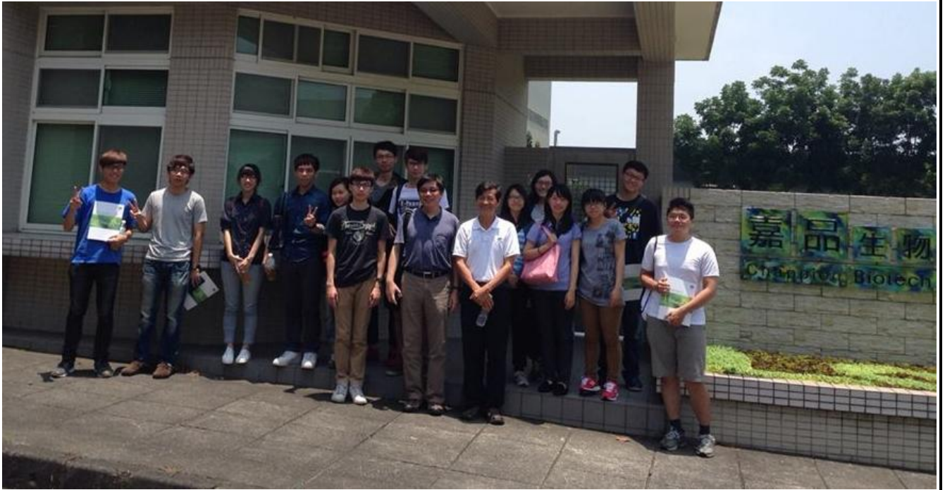
照片(一)說明:(合照)嘉年生化產品有限公司的第二個廠-嘉品生物科技