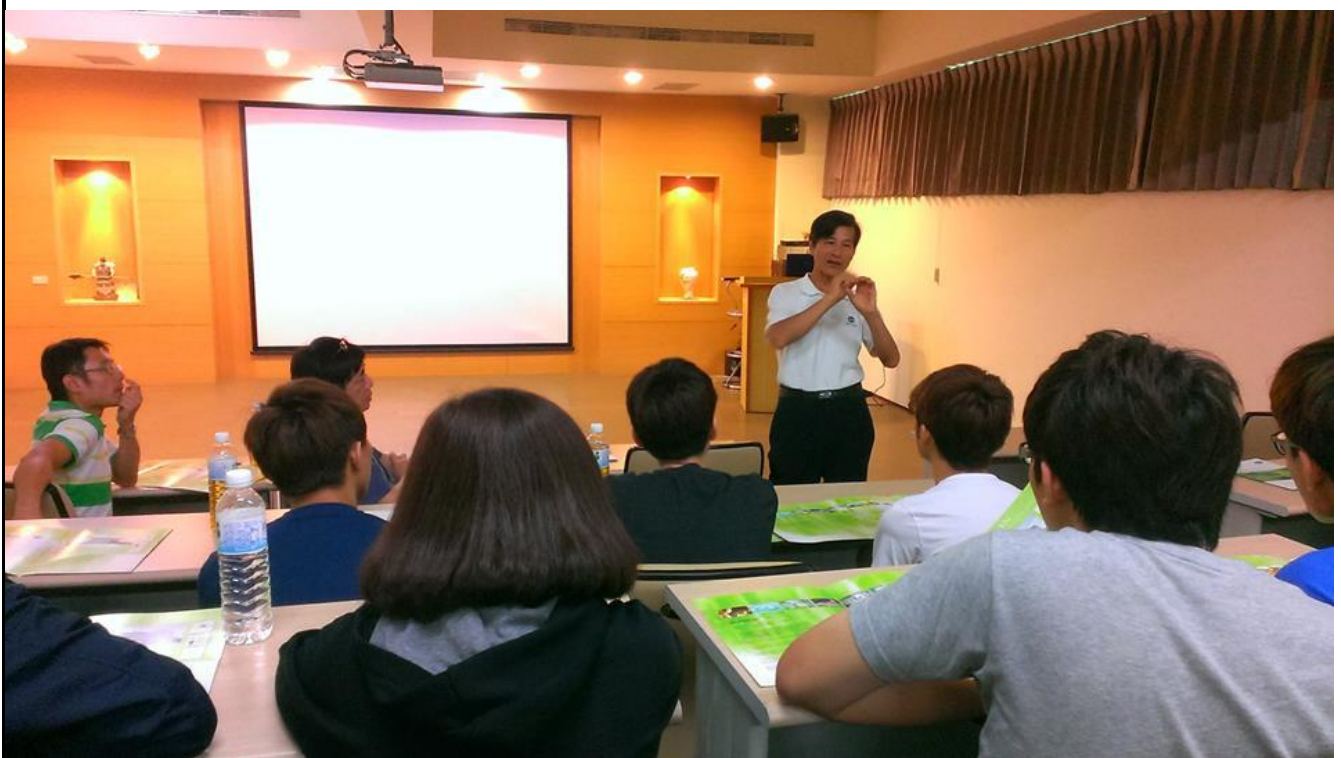
照片(四)說明:由董事長親自為各位解說公司生產的各個產品。